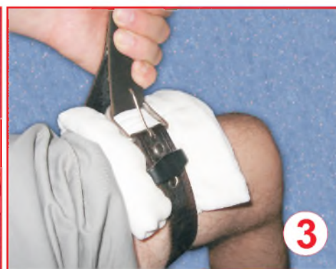
③ Брючный ремень

В качестве подручных жгутов могут быть использованы галстук, прочная ткань, скрученная в виде полосы шириной 2-3 см, неширокий брючный ремень.