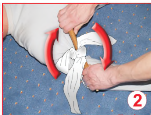
② Жгут - закрутка